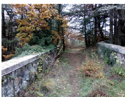
Vue depuis le passage supérieur