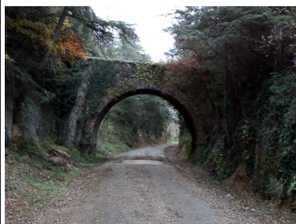
Ouvrage en passage supérieur