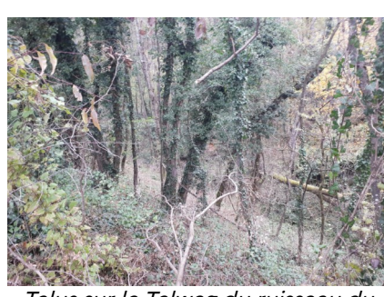
Talus sur le Talweg du ruisseau du Poulet